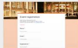
Event Registration Opened 3:52 PM

Google Forms is gratis. G-Suite is de betaalde versie. Zorg dat je vragen die gaan over persoonlijke data optioneel maakt. Gebruik indien gewenst two-factor authentication op je google account.