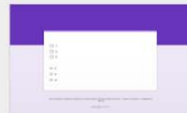
Untitled Form Opened 2:41 PM