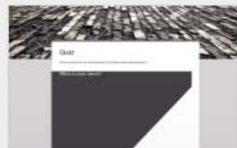
Quiz Opened 2:57 PM