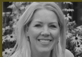
Isabel Juliana Albert Schweitzer Ziekenhuis